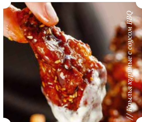
// Крылья куриные с соусом BBQ