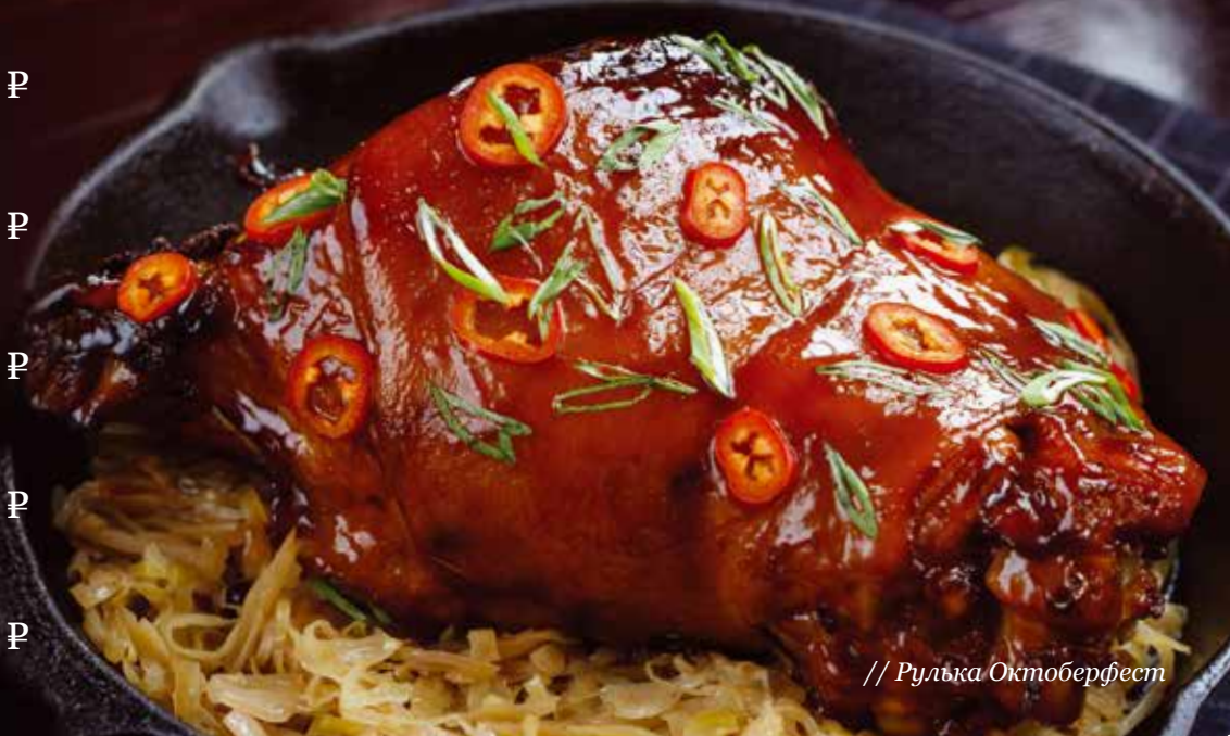
// Рулька Октоберфест

Говядина Веллингтон..... 990 Р классическое английское блюдо - говяжья вырезка с грибами, подается в слоеном тесте с пюре из топинамбура